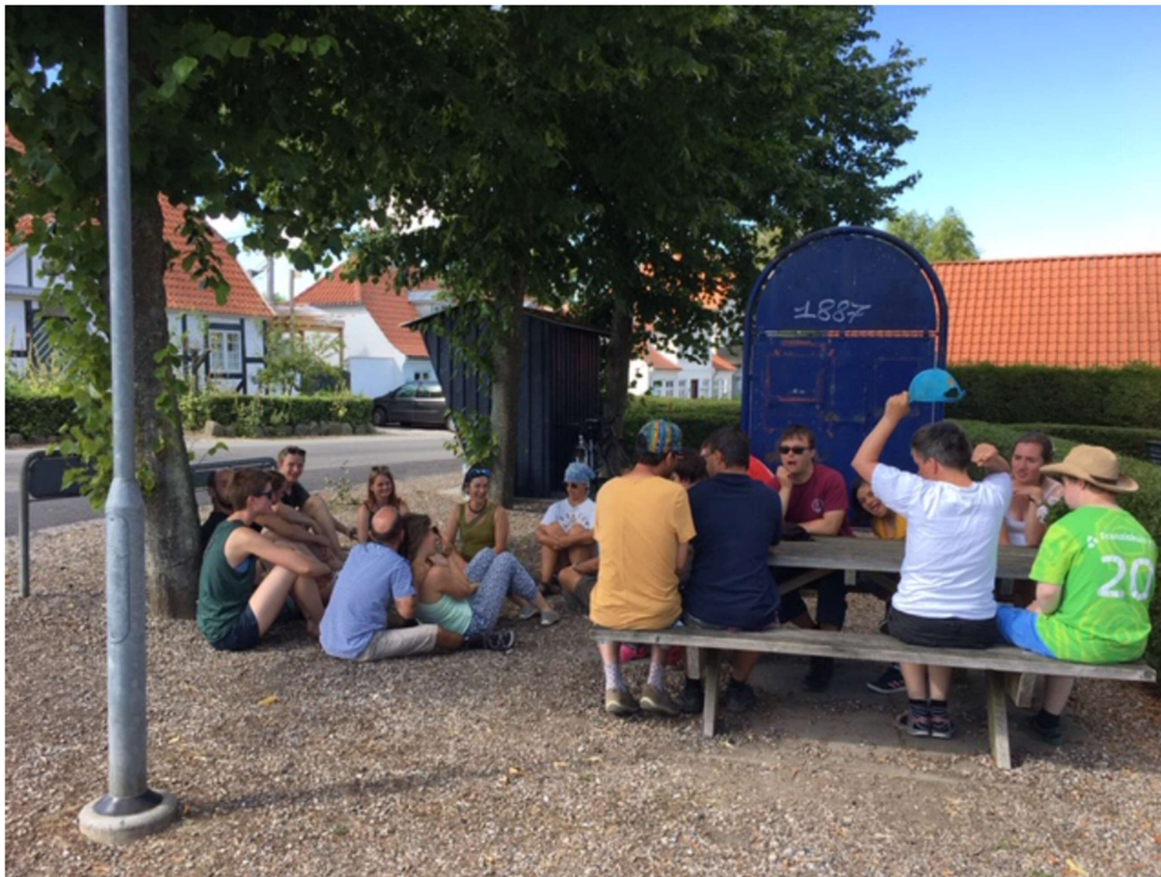
Bilag 3: Foto fra 10. 08. 20, der viser behovet for indretning af torvet til et funktionelt opholdsrum.