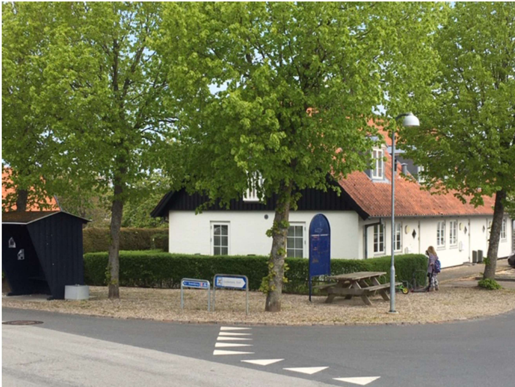
Bilag 1: Foto af det nuværende torv.