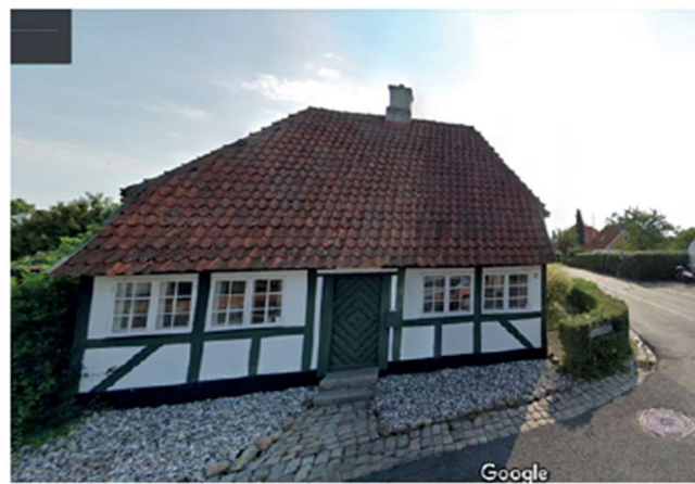
Troense Strandvej 2