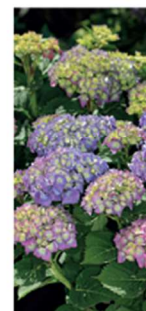
Elisa, 80 cm høj