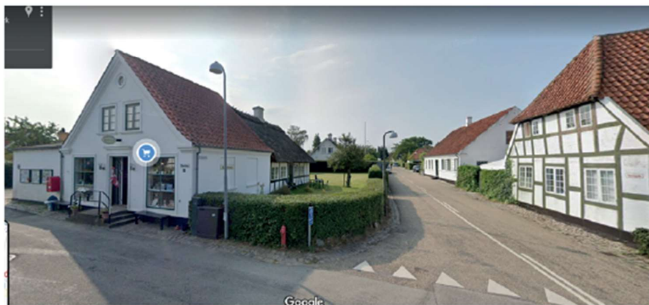
Grønnegade og Stormshjørne