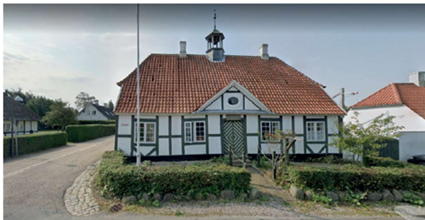
Troense gamle skole, Strandgade 1